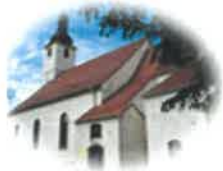
Kościół Św. Mikołaja