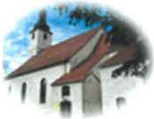
Kościół Św. Mikołaja