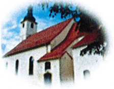
Kościół Św. Mikołaja