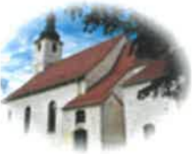
Kościół Św. Mikołaja