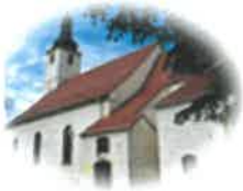
Kościół Św. Mikołaja