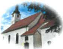
Kościół Św. Mikołaja