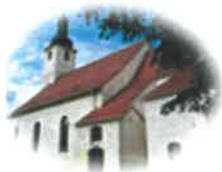
Kościół Św. Mikołaja