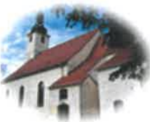
Kościół Św. Mikołaja