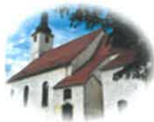
Kościół Św. Mikołaja