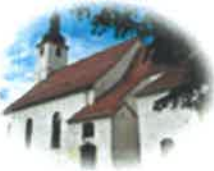
Kościół Św. Mikołaja