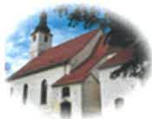
Kościół św. Mikołaja