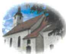
Kościół Św. Mikołaja