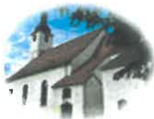
Kościół św. Mikołaja