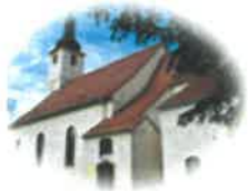
Kościół Św. Mikołaja