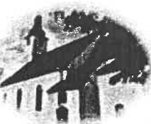
Kościół . Mikołaja