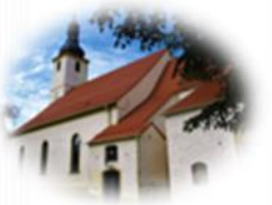
Kościół Św. Mikołaja